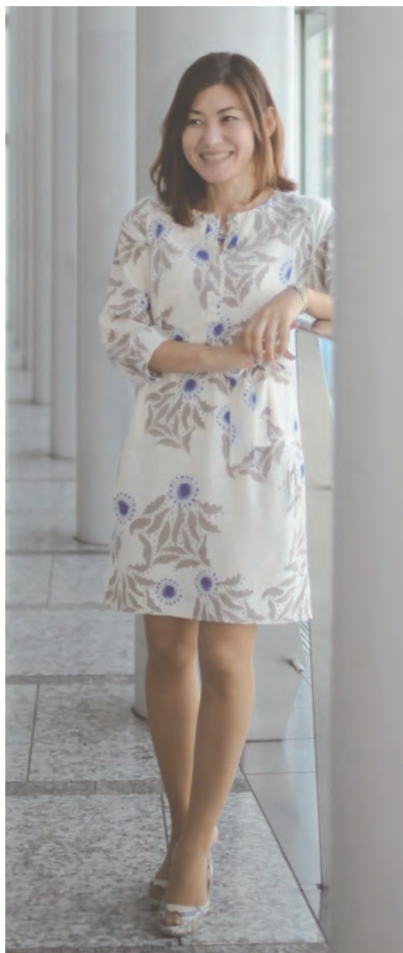
「セルフイメージ現実化法」講座も まもなくスタート

験に挑戦して合格し、その後、一年間で全国を回りました。例え受講生さんがひとりでも開催しました。その結果、ご紹介が増えて一年間で最多開催実績の講師になることができました。